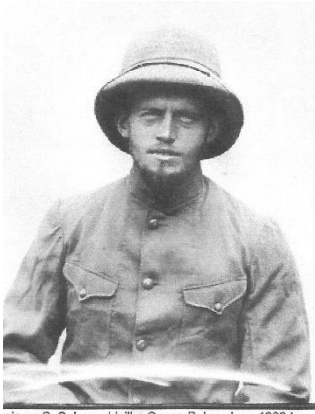
pin on S. S. Leopoldville, Congo Belge, June 1909 Imaq

provenance de l'État Indépendant du Congo. Il entre à l'université à l'âge de 17 ans mais stoppe ses études deux ans plus tard quand on lui propose de participer à l'expédition Lang en 1908 dans ce qui est encore pour quelques mois, l'EIC. L'expédition Lang durera cinq années jusqu'en 1914 mais elle ramènera saines et sauvées très les nombreuses pièces récoltées aux États-Unis où Chapin pourra poursuivre ses études. (5800 mammifères, 6400 oiseaux, 4800 reptiles et amphibiens, 6000 poissons, 100000 invertébrés, 9890 photographies, 300 aquarelles et 3800 spécimens anthropologiques). Chapin étudiera particulièrement les oiseaux du Congo et publiera un livre de 3055 pages en 4 volumes ( Birds of the Belgian Congo ). Au cours de sa longue carrière scientifique, il retournera 4 fois au Congo Belge et écrira de très nombreux articles relatifs à l'ornithologie dont il fut un maître incontesté.